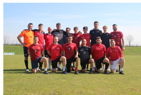
Unsere 1. Mannschaft war im März 2023 im Trainingslager in Verona IT